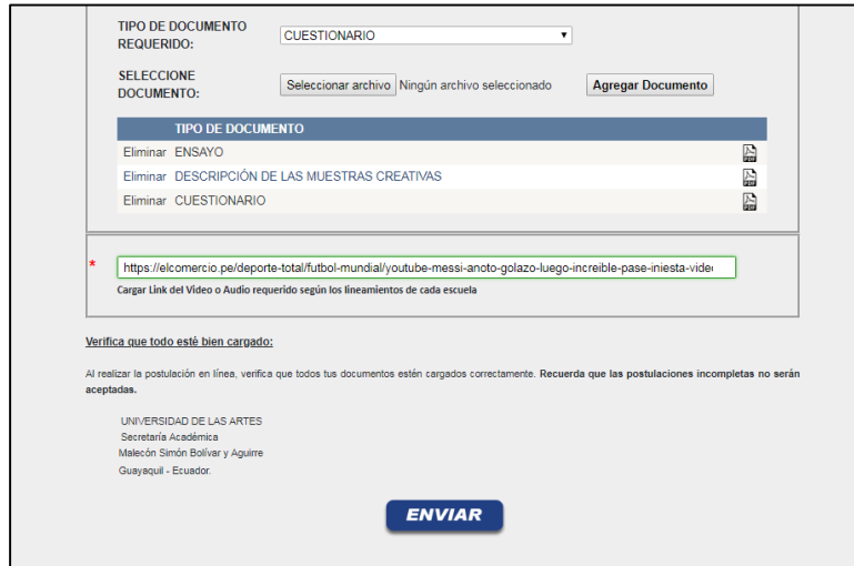
FIGURA 7 - DOCUMENTO AGREGADO

Luego de cargar la información correcta se procederá a dar clic en el botón ENVIAR . Al finalizar su postulación el sistema le indicará que sus datos han sido cargados correctamente.