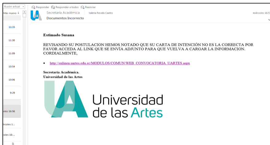
FIGURA 8 - NOTIFICACIÓN DE ERRORES

En caso de subir un documento que no corresponde a lo requerido por la carrera, se notificará por medio de correo electrónico y se le pedirá ingresar a un enlace que permitirá modificar su postulación. Tal como se muestra en la Figura 8.