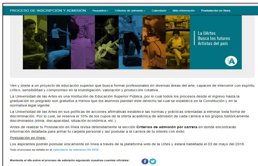
FIGURA 1 - PANTALLA INICIAL DE POSTULACION – UARTES

A continuación, en la Figura 1, se muestra la imagen de la página web del proceso de admisión.