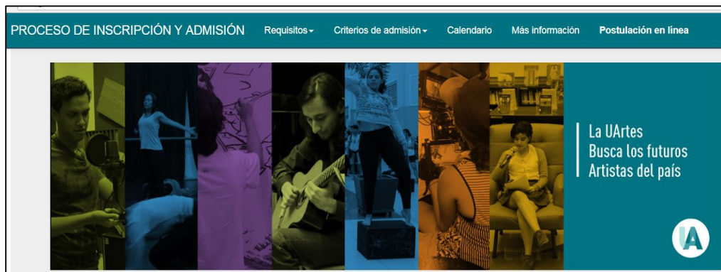
FIGURA 2 - MENÚ PRINCIPAL

Requisitos: en esta sección se desplegarán dos documentos, Requisitos Generales y Normativa. Cada documento contiene los distintos pasos y etapas que involucra el proceso de admisión.